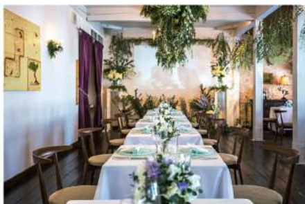
ブランシュメゾン TEL. 011-522-5353

札幌市中央区双子山4丁目1-18 収容人数 120名様まで 営業時間 11:00-19:00 (月曜定休)