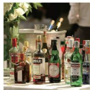
カクテル各種追加 お1人様 ¥500