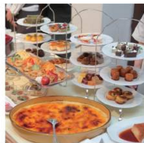
デザートbuffet追加 お一人様 ¥1,100