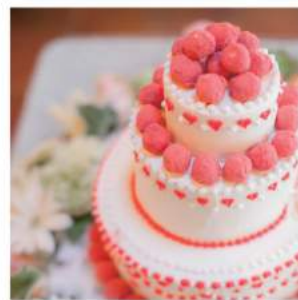
ケーキ 要相談 (バースデーケーキなど)