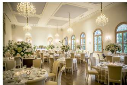
ピエトラ セレーナ TEL. 011-522-1212

札幌市中央区伏見1丁目4-30 収容人数 50名様まで 営業時間 11:00-19:00 (水曜定休)