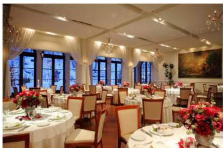
ジャルダン・ドウ・ボヌール TEL. 011-530-0877

札幌市中央区双子山4丁目1-18 収容人数 120名様まで 営業時間 11:00-19:00 (月曜定休)